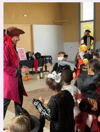
L'équipe de l'IFAC